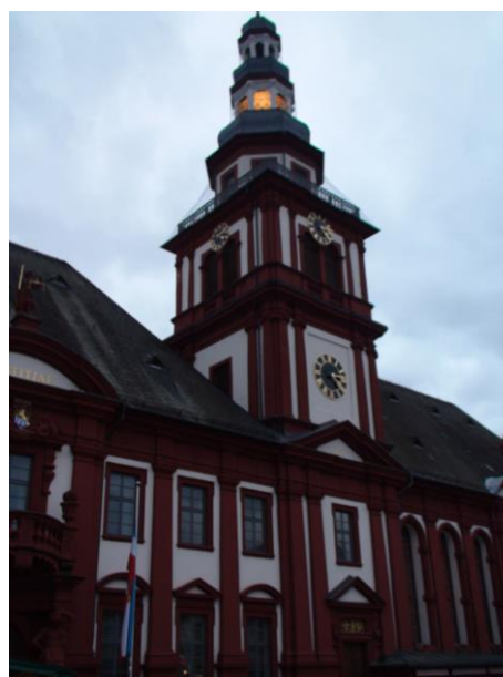
Altes Rathaus und Pfarrkirche St. Sebastian