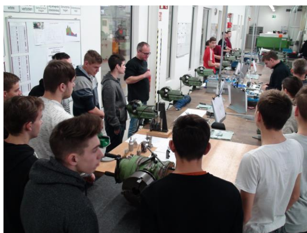
Tanműhely – vizsga-remek