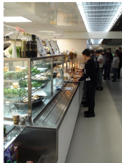
Az éttermükben ...